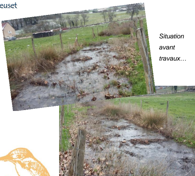
Situation avant travaux...

Le ruisseau du Creuset, situé sur la commune de Nod-sur-Seine, présentait une sur-lageur sur une distance d'environ 150 mètres. La végétation basse s'y était fortement développée, gênant ainsi l'écoulement de l'eau. La présence d'un passage à gué constitué de buses et mal positionné représente également un obstacle.