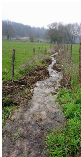
... Et après travaux !